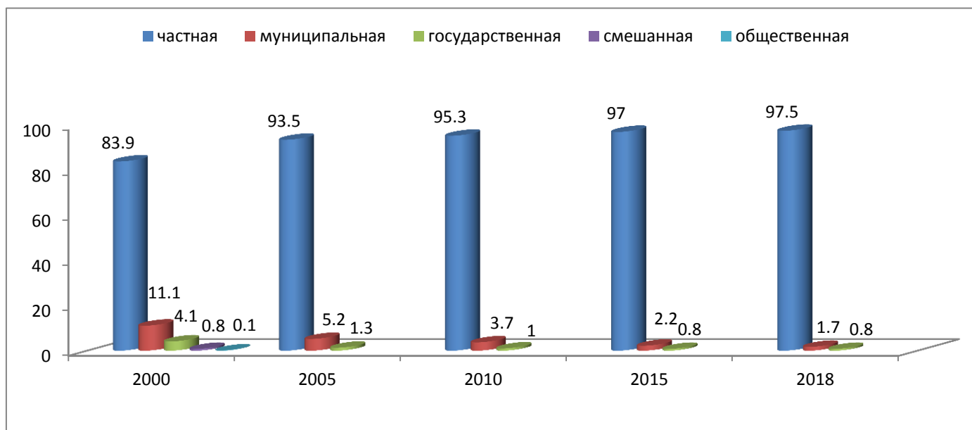
ЖИЛИЩНЫЙ ФОНД ПО ФОРМАМ СОБСТВЕННОСТИ (в процентах)

В республике по числу комнат в общем числе квартир, с учетом домов (индивидуально-определенных зданий), преобладают двух- и трехкомнатные квартиры (39,8% и 31,4%). Средняя площадь квартиры составляет 62,3 кв. м, в однокомнатных – 35,2 кв. м, в двухкомнатных – 48,7 кв. м, трехкомнатных – 66,9 кв. м, четырехкомнатных – 112 кв. м.